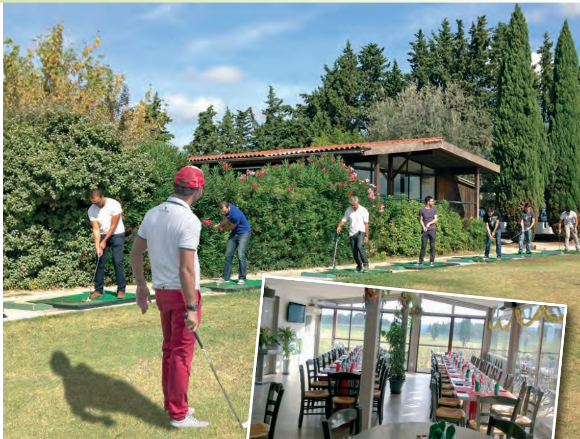
... et un restaurant agréable, avec vue sur le practice de golf... et la Sainte-Victoire.

Il va falloir mettre les bouchées doubles pour que le projet soit réalisé à temps. A la croisée des chemins, la famille Taille est déterminée à prendre la bonne direction. Et si l'évènement interplanétaire que constitue la Ryder Cup pouvait être contemporain de l'ouverture du nouveau site d'Aix Golf, la famille Taille pourrait se féliciter d'avoir réussi le plus beau trou en un de son parcours.