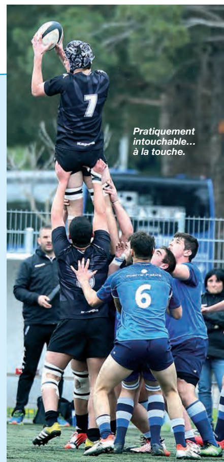
Pratiquement intouchable... à la touche.