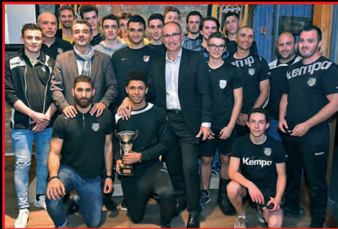
De l'école de handball à la LNH, en passant par les structures section sportive, Ecole Sport Entreprendre (ESE), le pôle espoirs et les équipes du PAUC... Vous avez dit formation ?