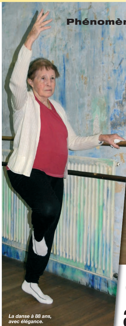
La danse à 88 ans, avec élégance.