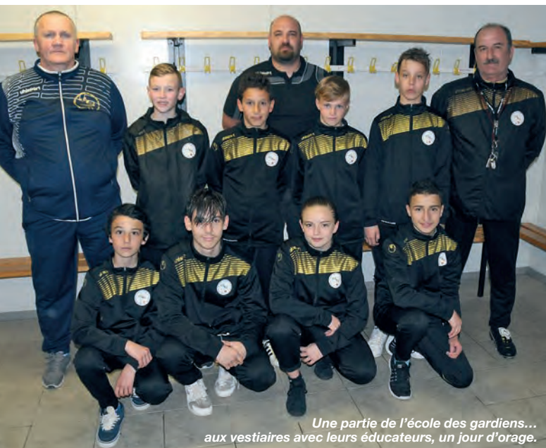
Une partie de l'école des gardiens... aux vestiaires avec leurs éducateurs, un jour d'orage.

(16/12/2005) AS Nord Aix. "Nouveau également. Très speed, il travaille, il aime... Donc, on attend la suite."