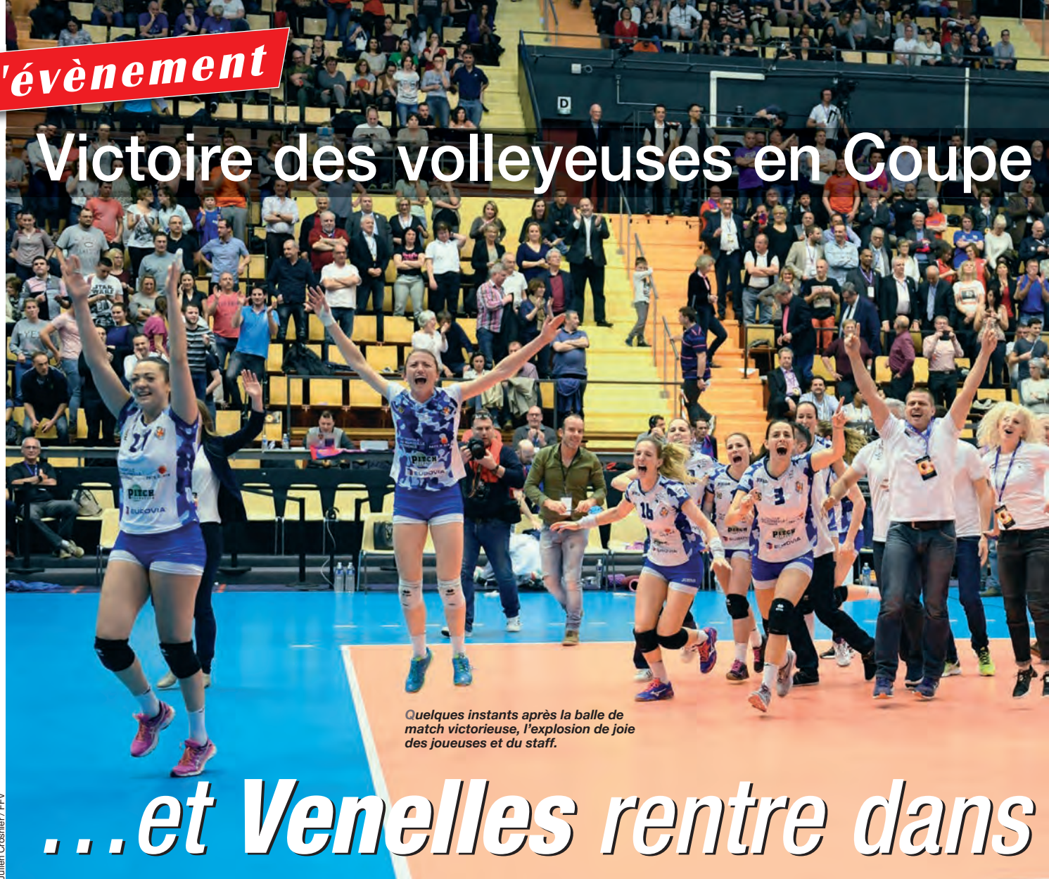
Quelques instants après la balle de match victorieuse, l'explosion de joie des joueuses et du staff.