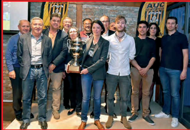
Club toujours présent à haut niveau, double médaillés des Championnats d'Europe (médaillé d'argent en 2015), 3 e du Championnat de France par équipe en 2016. Un club génial !