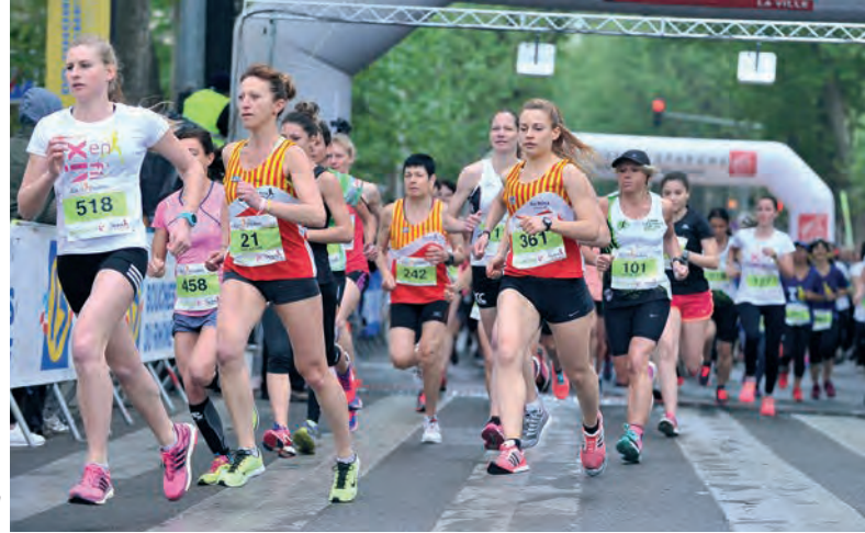
Les filles en bonne place.

Pour sa 9 e édition, cette grande épreuve de masse va créer encore une joviale animation sur les boulevards extérieurs d'Aix et les routes aux alentours. Aix Athlé Provence attend encore plus de 2000 participants répartis sur les parcours de 20 km, 10 km (épreuve qualificative pour le Championnat de France) et 5 km ("Aix en Filles"). La Rotonde et l'avenue Bonaparte restent au cœur d'une manifestation qui s'associe à l'Association Mécénat Chirurgie Cardiaque et sera parrainée par la star du handball, Jérôme Fernandez. Cela se passe en matinée, à partir de 8 h 55.