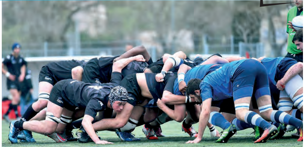
Un 3 e ligne qui n'a pas peur d'aller au charbon.

Il nous confiera qu'il préfère avoir mal joué et que l'équipe ait gagné, plutôt que d'avoir fait un gros match dans une équipe vaincue, "même si, dit-il, la frustration serait là. Quand je joue mal, dit-il, je m'en veux. Je me dis que je n'ai pas su aider mes partenaires sur le terrain, que je n'ai servi à rien. L'équipe, c'est ce qui compte le plus."