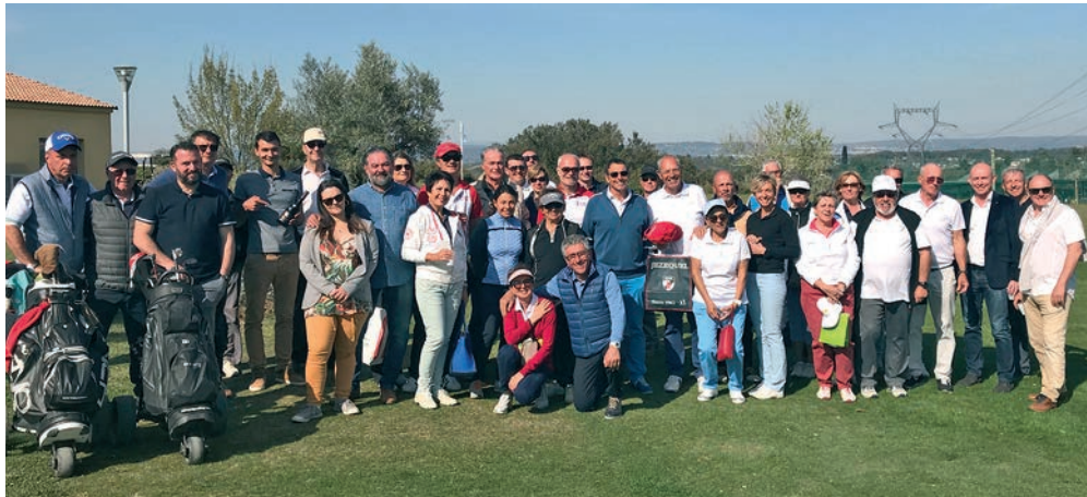
Une partie des participants sur le golf de la Cabre d'Or, à Cabriès-Calas.

Fondation s'est vu remettre un don de 1910 €, grâce aux droits de jeu des 108 participants (maximum autorisé) et au soutien du Conseil régional Sud PACA, de la fédération de golf et des partenaires privés. Cette belle journée fut agrémentée d'une sympathique remise de récompenses et d'une dégustation de vins bio, dans un beau climat de solidarité et de convivialité. Chapeau L'ASPTT Golf !