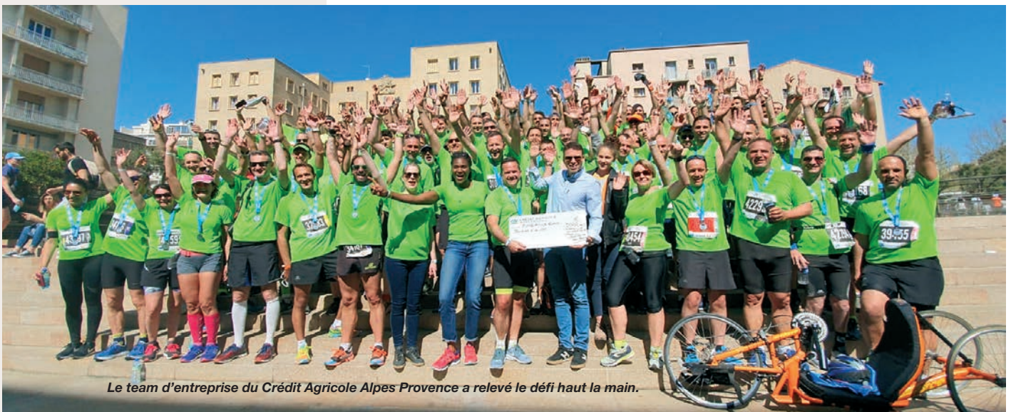
Le team d'entreprise du Crédit Agricole Alpes Provence a relevé le défi haut la main.

administrateurs) de la banque coopérative à porter le maillot vert, contribuant ainsi au don de 5000 € versés à l'association "Sourire à la vie", laquelle a pour but de proposer un accompagnement des enfants atteints de cancer. Un bel exemple de solidarité.