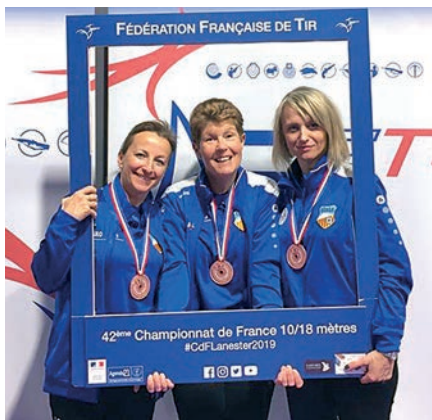
Les féminines de la STASA plein cadre au championnat de France.