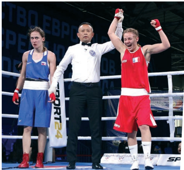
Visiblement plus heureuse que son adversaire à l'instant du verdict.