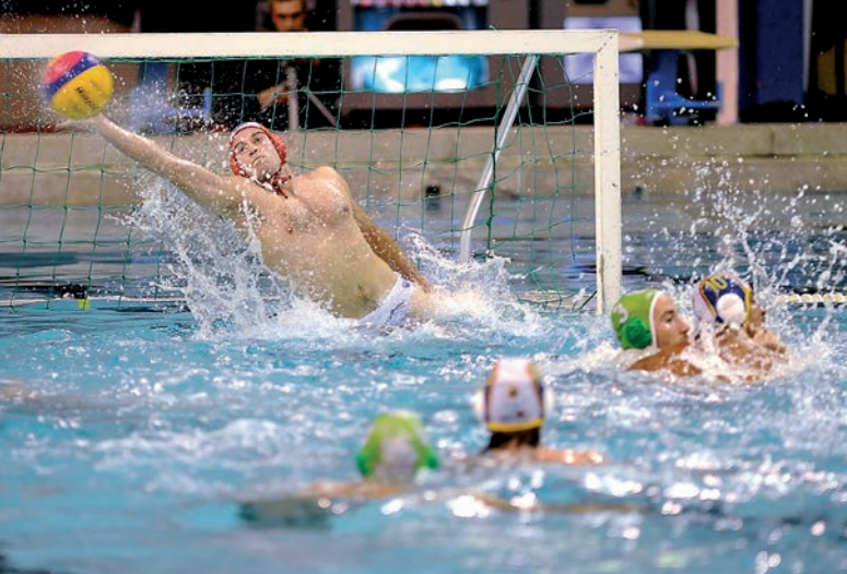
Toujours capable de tenir sa place dans les buts de l'équipe aixoise.