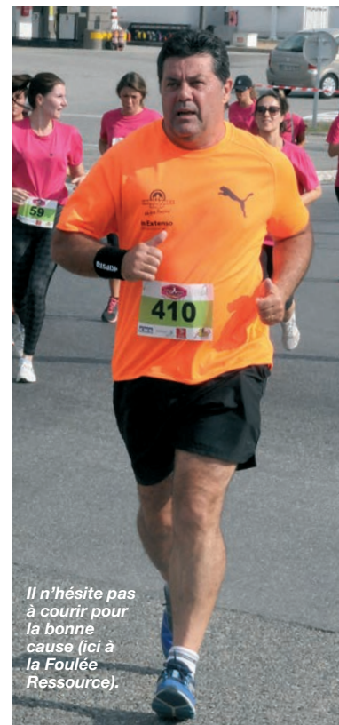
Il n’hésite pas à courir pour la bonne cause (ici à la Foulée Ressource).