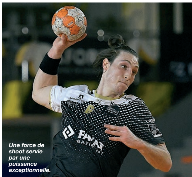
Une force de shoot servie par une puissance exceptionnelle.

A plus court terme, le jeune Aixois pense au championnat du monde espoirs qu'il espère