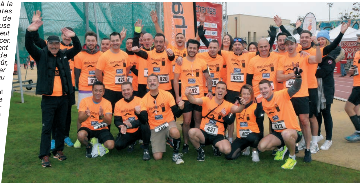
L'imposante équipe PLD Automobiles rassemblée avant le départ des Bacchantes, sur le stade Carcassonne.