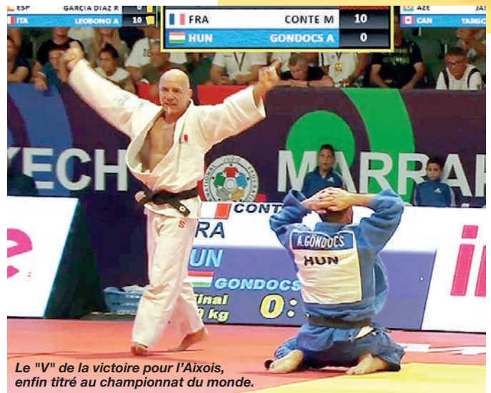
Le "V" de la victoire pour l'Aixois, enfin titré au championnat du monde.