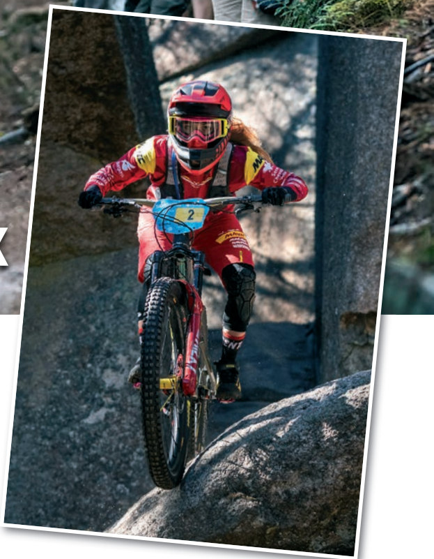
... qui sait retomber sur ses deux roues.

une marge de progression. Je dois travailler un peu dans tous les domaines. J'utilise beaucoup le BMX et je vais rouler sur la route pour "me faire la caisse". L'objectif est de me maintenir à la première place mondiale et surtout de continuer à évoluer, à progresser et à me faire plaisir."