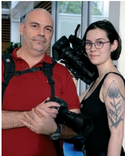
Sauvage père et fille, preneurs d'images.

Hélène a du caractère, de la suite dans les idées et un goût évident pour les images... "comme papa", mais avec l'avantage de pouvoir les mettre en mouvement.