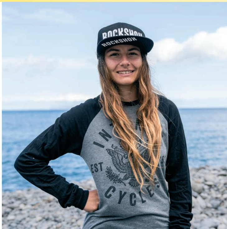
Une jeune femme positive au caractère bien affirmé.