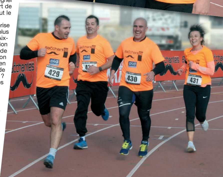
L'esprit d'équipe symbolisé par ce jovial quatuor à l'arrivée sur la piste.