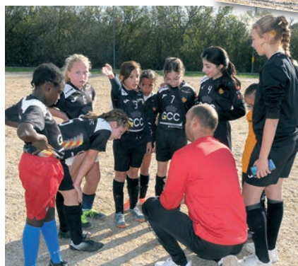
A la mi-temps, on a pu discuter de la tactique.