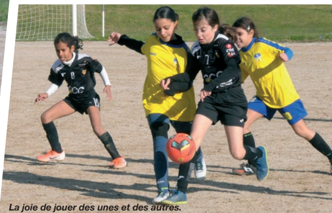
La joie de jouer des unes et des autres.