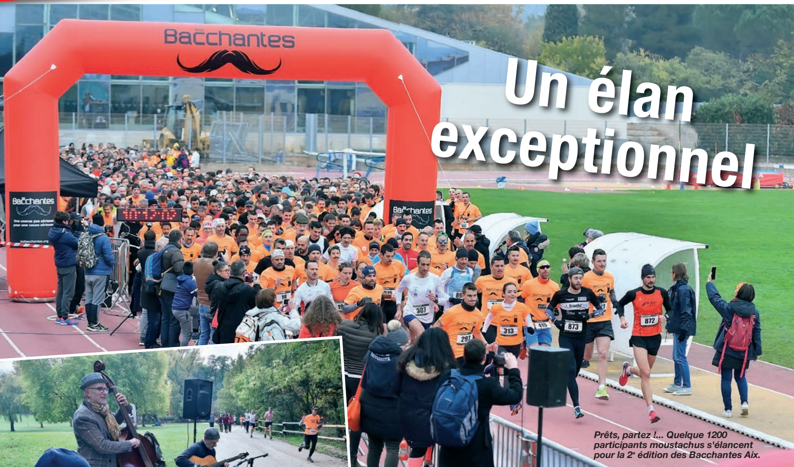
Prêts, partez !... Quelque 1200 participants moustachus s'élancent pour la 2 e édition des Bacchantes Aix.