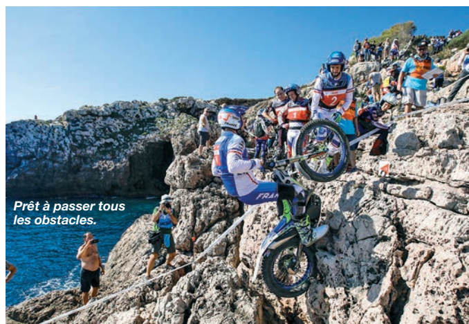
Prêt à passer tous les obstacles.

Quand on évolue sur un site aussi sublime que celui de la Trévaresse, le respect de l'environnement fait (aussi) partie des priorités.