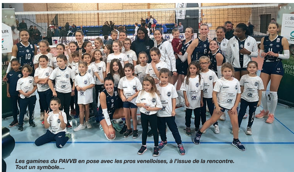
Les gamines du PAVVB en pose avec les pros venelloises, à l'issue de la rencontre. Tout un symbole...