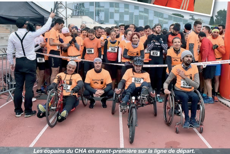
Les copains du CHA en avant-première sur la ligne de départ.