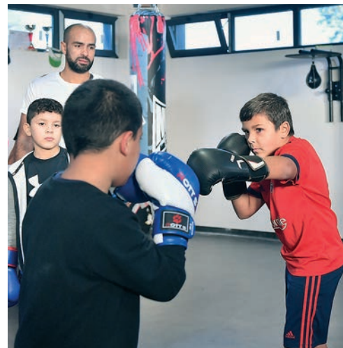
Au BC Hippo, on apprend les rudiments de la boxe dès l'enfance.

Avec une salle de boxe de 100 m 2 (10 sacs de frappe, une trentaine de paires de gants) et une autre structure comprenant les vestiaires (4 douches), un espace musculation-training et un coin bureau, le BC les