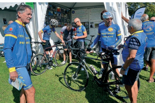
Un président actif qui se donne à fond pour son club.

A noter que ces deux dernières années, le CSPA était associé à l'AVCA dans l'organisation de la "Rando du Pays d'Aix", la veille de la Provençale Sainte-Victoire. Joli programme en effet !