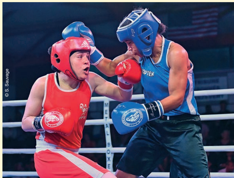
Une combativité de tous les instants sur le ring comme en dehors.

Mohammedi mettra toute son énergie et sa passion pour atteindre son objectif olympique.