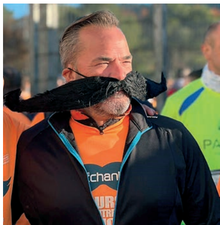
PLD Auto a mérité également le prix des plus belles moustaches. N'est-ce pas ?

Le parallèle avec le sport ne s'arrête pas là. Les objectifs de l'entreprise PLD Auto, qui ne compte pas moins de 550 collaborateurs, sont assez semblables à ceux d'un grand club dans sa volonté d'aller de l'avant... et de faire évoluer ses membres. La politique d'alternance pratiquée au sein de l'entreprise aixoise, laquelle offre à une cinquantaine de jeunes, principalement issus des CFA et du GNFA, la possibilité de rentrer dans la vie professionnelle, n'est pas sans faire penser à ce qui se développe dans les centres de formation des grands clubs sportifs. "Les maîtres mots : Accueillir, Former, Développer."