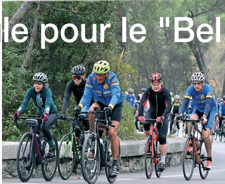
Le peloton de tête attaque allègrement le "col des Platanes".

nombre de "grands enfants" à la joie de vivre bienfaisante. Priorité à la santé et au plaisir. Tel est le mot d'ordre des dirigeants du CSPA dont le discours n'a pas changé depuis 50 ans. On vous parle de sécurité, de civisme, de respect de la nature, de camaraderie... mais pas de classements ou de moyennes horaires.