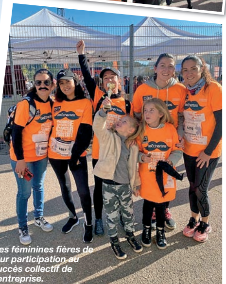
Des féminines fières de leur participation au succès collectif de l'entreprise.