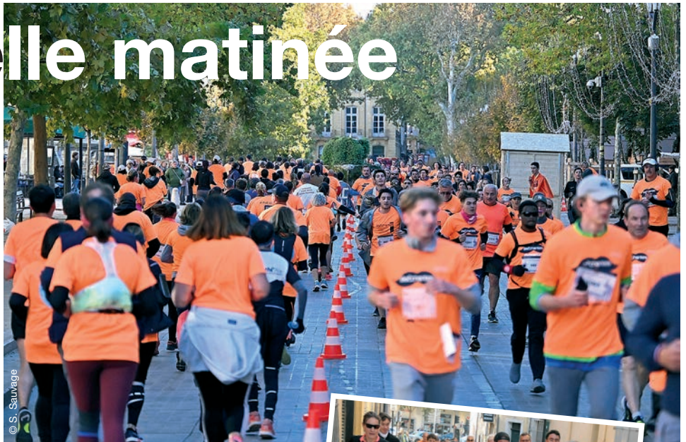
Le Cours Mirabeau aux couleurs des Bacchantes. Une belle image !

L'ambiance particulièrement saine et chaleureuse qui entoure les Bacchantes ne peut, en effet, qu'inciter les participants à y revenir et à convaincre les copains de les rejoindre. Une ambiance souriante, des opérations de départ jusqu'au protocole final, en passant par la course elle-même, 8 km (ou presque) à travers les rues d'Aix, le Cours Mirabeau, et le parc de la Torse, avant le final particulièrement spectaculaire... et parfois très disputé sur la piste d'athlétisme. Tout cela avec l'accompagnement sonore des cinq orchestres situés sur le parcours, les encouragements de centaines de supporters et le concours d'une centaine de bénévoles placés sur