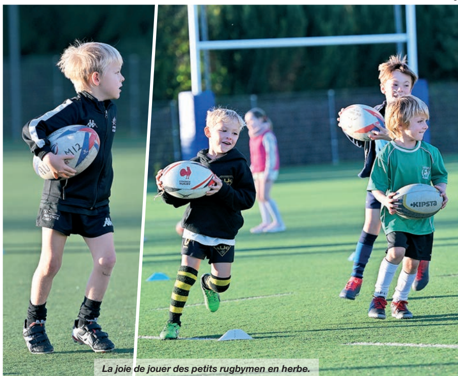
La joie de jouer des petits rugbymen en herbe.