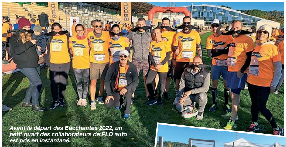
Avant le départ des Bacchantes 2022, un petit quart des collaborateurs de PLD auto est pris en instantané.