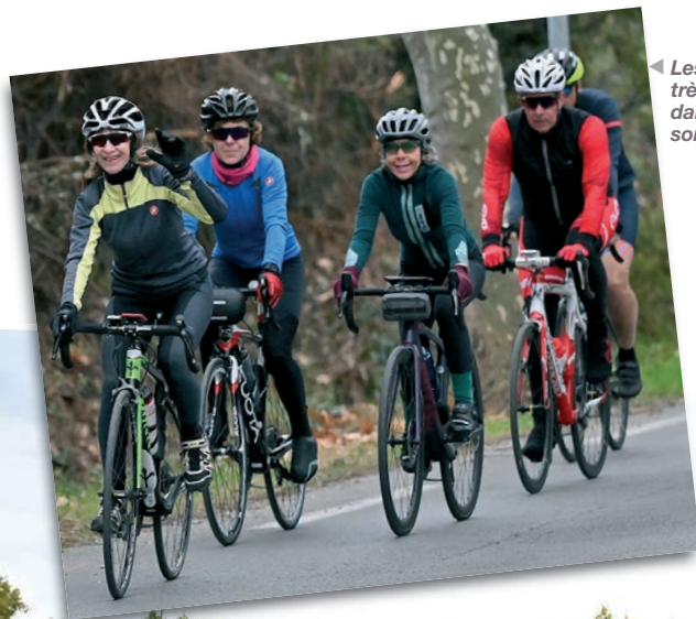
Les femmes très présentes dans les sorties.