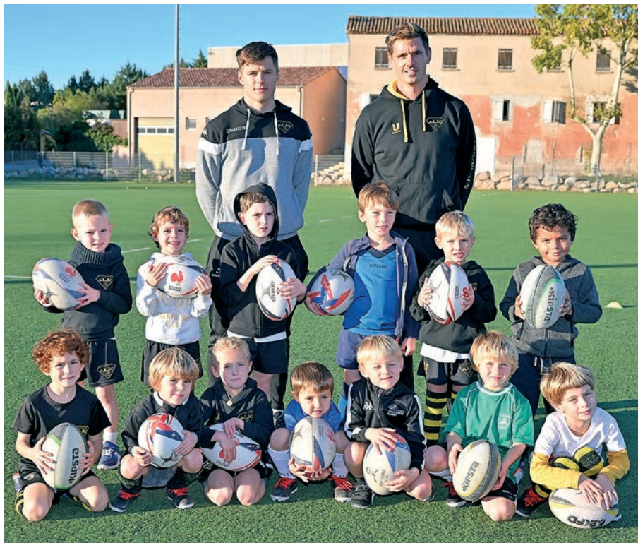
Un groupe de gamins à l'école du mercredi au Val de l'Arc.