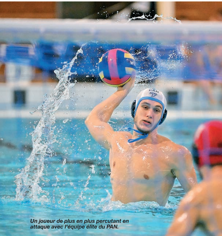
Un joueur de plus en plus percutant en attaque avec l'équipe élite du PAN.