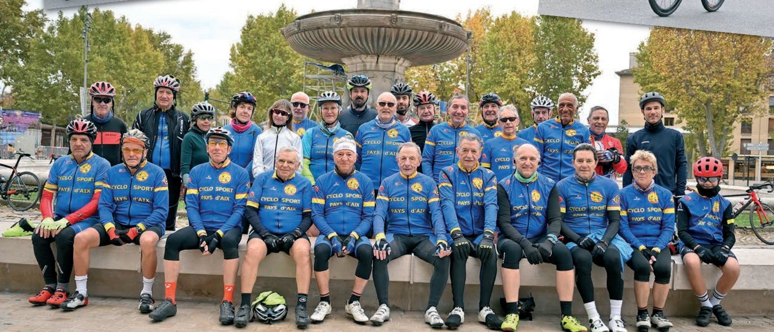
Ce dimanche-là, 29 des 187 licenciés du CSPA sont au rendez-vous à la Rotonde.